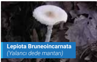
Lepiota Bruneoincarnata (Yalancı dede mantarı)