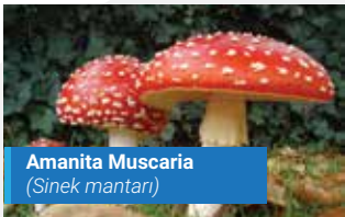
Amanita Muscaria (Sinek mantarı)