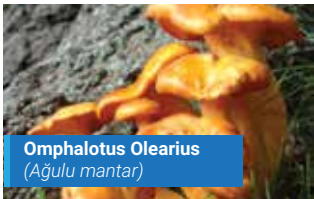
Omphalotus Olearius (Ağulu mantar)